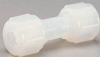
ユニオン・ストレート