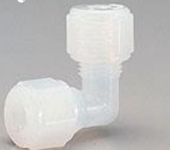
ユニオン・エルボー